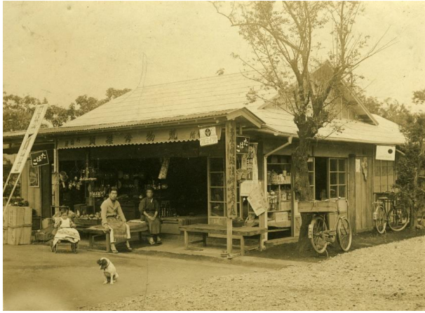
拝島駅前内出商店 大正14（1925）年6月9日撮影