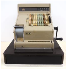
キャッシュレジスター